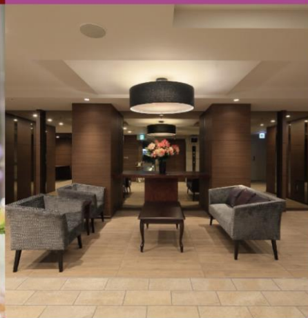
サービス付き高齢者向け住宅 SOMPOケア グレイプスシリーズ

全国土木建築国民健康保険組合の組合員本人（OBを含む）およびその4親等以内の方がご入居の場合