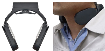
ネッククーラー Slim (4083 0076 10)