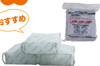
スーパーダッシュバッグ DBW-02 (4073 2514 10)