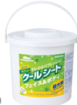
やさしい クールリフレ (4083 0091 03)