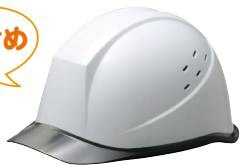
SCH-11PCLV RA3 UP ホワイト/スモーク (4003 1135 03)