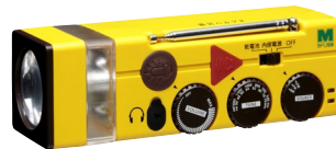
多機能ラジオライト 震災ヘルプII (4082 0806 24)