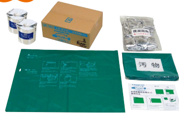
緊急対策用トイレ ベンリー袋R100回分セットA トイレレットペーパー付 (4082 1109 62)