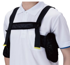
クールホルダ1dayセット CH-001 (4083 0068 01)