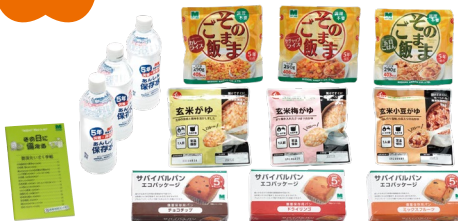
そのまま食べられる保存食セット3日分 ST3-05 (4082 1005 08)